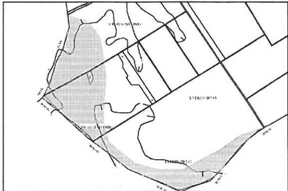
Településképi szempontból meghatározó területek - Természetvédelmi, tájképvédelmi oltalom alatt álló külterületek