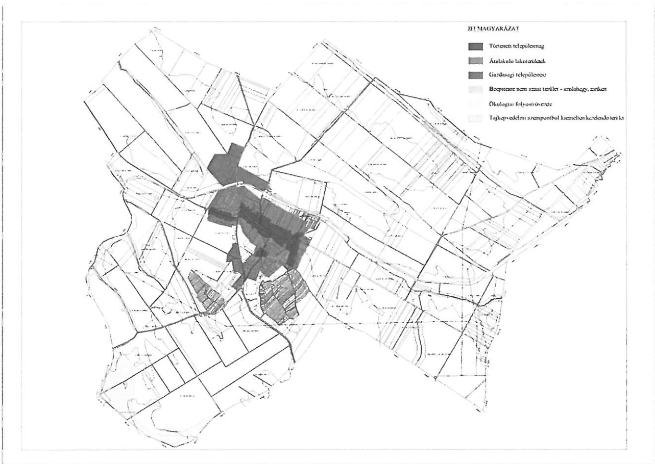
A külterületen lévő védelem alatti területeket a teljes közigazgatási terület ábrázolásával