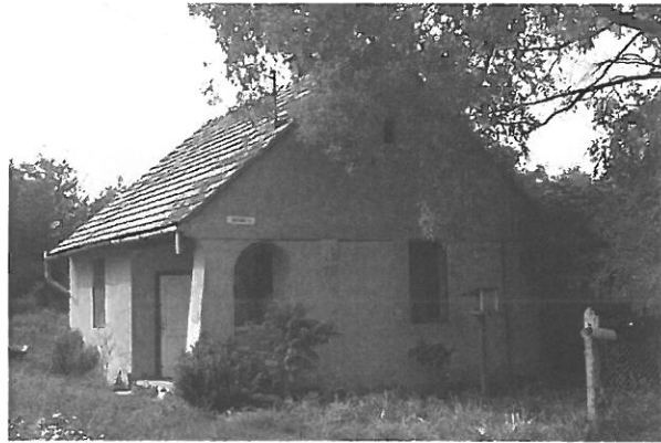
József Attila Kultúrház